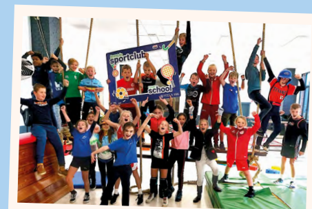
In sportoutfit naar school!

Op woensdag 27 september is het zover: alle leerlingen van het basis- en secundair onderwijs trekken hun sportoutfit aan en gaan in stijl naar school. Dit is het moment om jouw vrienden in de klas te laten zien hoe tof het is om te sporten en hen aan te moedigen om zich aan te sluiten bij een sportclub!